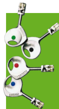
Cylindre 787 Z

Nos produits sont garantis 10 ans. Voir conditions auprès de votre Point Fort Fichet ou sur notre site www.fichet-pointfort.com