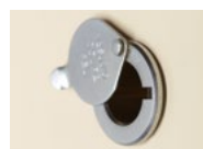
MICROVISEUR CLASSIQUE Chromé ou laiton