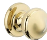
POMMEAU PVD laiton poli ou chromé velours