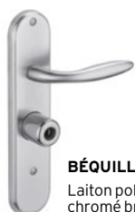
BÉQUILLE Laiton poli ou chromé brossé