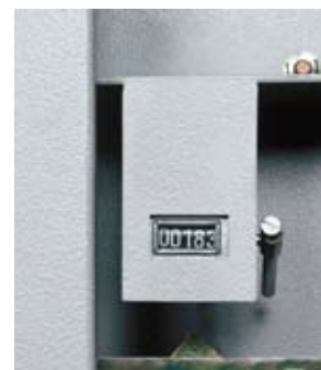
Le compteur et le scellé du foncet (en option): de précieux indices pour savoir si l'armoire a été ouverte en votre absence.